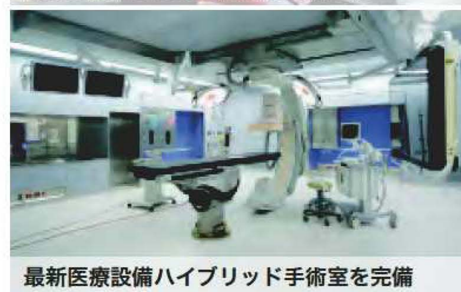
最新医療設備ハイブリッド手術室を完備