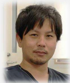
文責 山中 将太